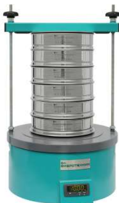
Анализатор А 20 на базе ВП 30Т