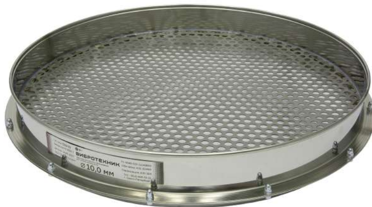
Сито С 50/70 с круглой перфорацией