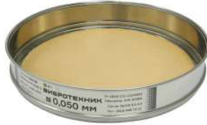
Сито С 20/38 с сеткой из бронзы