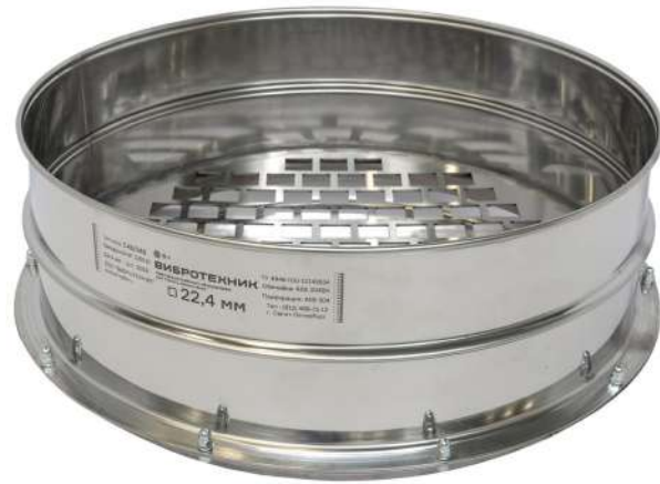
Сито С 40/140 с квадратной перфорацией