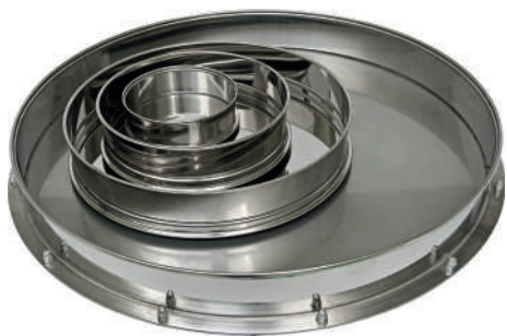
Поддоны диаметром 120, 200, 300 и 500 мм

Поддон грохота предназначен для непрерывной разгрузки в приемную емкость материала, прошедшего через нижнее сито.