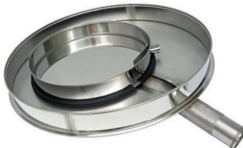
Поддоны Грохота ГР 30 и ГР 50