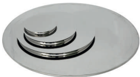
Крышки диаметром 120, 200, 300 и 500 мм