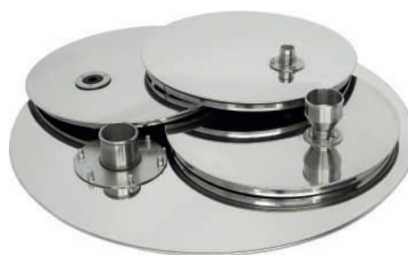
Крышки ГР 30 с мембраной, патрубком и воронкой Крышка ГР 50 с патрубком