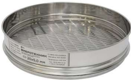
Сито С 30/50 с продолговатыми отверстиями