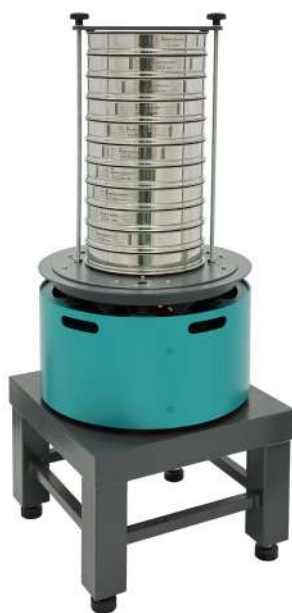
Анализатор А 30 на базе ВП 50 на Тумбе Т 40