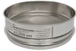
Сито контрольной точности С 20/50К с сеткой из нержавеющей стали