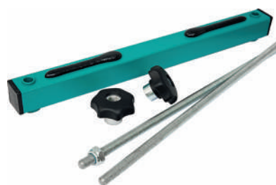
Устройство крепления сит УКС