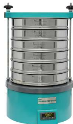
Анализатор А 30 на базе ВП 30Т