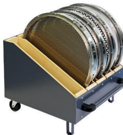
Кассета для сит С 50/70 и сит ГР 50