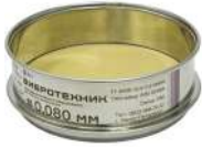
Сито С 12/38 с сеткой из латуни