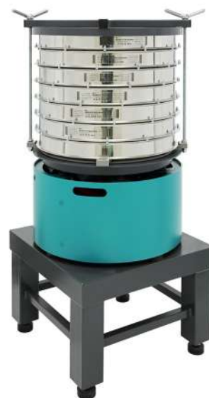
Анализатор А 50 на базе ВП 50 на Тумбе Т 40